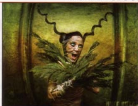
...durch gezielte Retuschen und Montagen wurde das eigentliche Bild gestaltet

nicht nur um die Vermittlung theoretischer Kenntnisse, sondern auch darum, seinen Schülern den kreativen Umgang mit diesem Werkzeug zu vermitteln und sie dazu anzuhalten, individuelle Phantasien umzusetzen und so einen eigenen Weg zu finden. Dazu gehört vor allem, sich von allen Einflüssen und Zwängen zu befreien. Buchta und sein Werk lassen sich nicht zuletzt deswegen so schwer beschreiben,