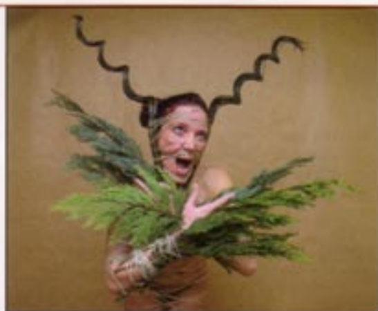
Das Ausgangsfoto zu "Xmastree" ist verblüffend einfach...