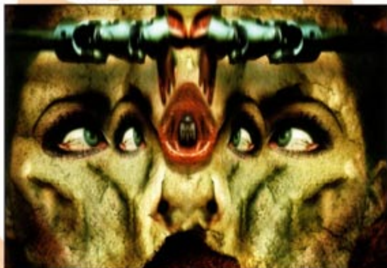
Some Kind of Fear