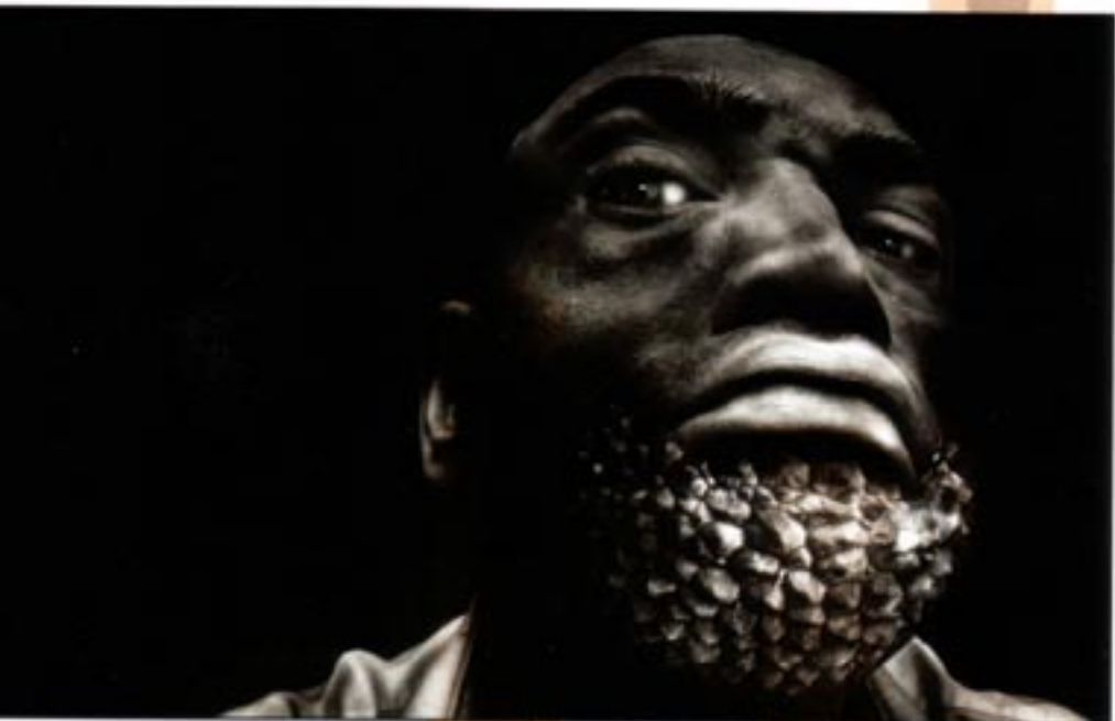
Erst auf den zweiten Blick fällt auf, dass der Kinnbart eine implantierte Litschifrukt ist

nervenaufreibender Prozess, den Models vor der Kamera tiefe und ebenso glaubhafte Emotionen zu entlocken. Thomas Buchta erreicht dieses Ziel mit spielerischer Leichtigkeit.